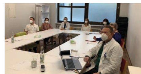
Das Team der Schmerztherapie beim virtuellen Schmerzkongress 2021

Der Zeitraum der coronabedingten Schließung der Abteilung wurde vom Team der Schmerztherapie intensiv genutzt, Verbesserungen am Angebot für Patienten mit chronischen Schmerzen zu arbeiten. Neueste Studienergebnisse wurden ausgewertet und in die bestehenden Konzepte eingearbeitet.